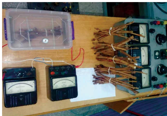
2-расм. Узум қаламчаларига электр ишлов бериш жараёни

Тажрибада жами 36 та узум қаламчаларидан фойдаланилди. Электр токи ёрдамида ишлов берилган узум қаламчалари сони 30 та ва 6 та назорат учун қолдирилди (2-расм). Тажрибада саноат частотали (50 Гц) ўзгарувчан токдан фойдаланилди. Тажрибада электр майдон кучланганлигининг 71 В/м да ишлов берилди. Қаламчаларга ишлов бериш вақтлари 4, 8, 12, 15, 24 соатни ташкил қилди. Назарий жиҳатдан қараганда ўсимлик объектларига электр ишлов беришда (масалан, узум қаламчалари) ишлов бериш уларнинг алоҳида қисмларини электр занжирининг элементлари сифатида қараш мумкин.